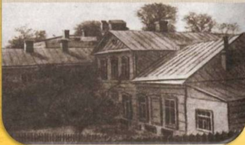
Дом на Житной улице, где прошло детство А.Н. Островского.